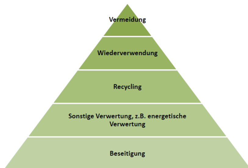
Abb. 3: Fünfstufige Abfallhierarchie der europäischen Abfallrahmenrichtlinie 2008/98/EG 17

Da viele Kommunen ihre Bürgerinnen und Bürger auffordern, Biokunststoffe in der Restmülltonne und keinesfalls in der Biotonne zu entsorgen, ist davon auszugehen, dass die meisten Abfälle aus Biokunststoffen in Müllverbrennungsanlagen verbrannt werden. 18 Die Verbrennung von Bioplastik entspricht lediglich der vierten Hierarchiestufe der Europäischen Abfallrahmenrichtlinie und ist weit davon entfernt ressourcenschonend und umweltfreundlich zu sein.